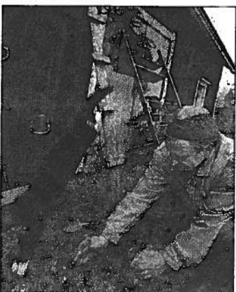
Leeville, 21 vuotta, isäntä on rakentanut omat portaat, jotka vievät verstaan vintille.

”Taide kumpuaa ristiriidasta. Sitä pyrkii jollain tavalla ratkomaan olemassaolon problemaa.”